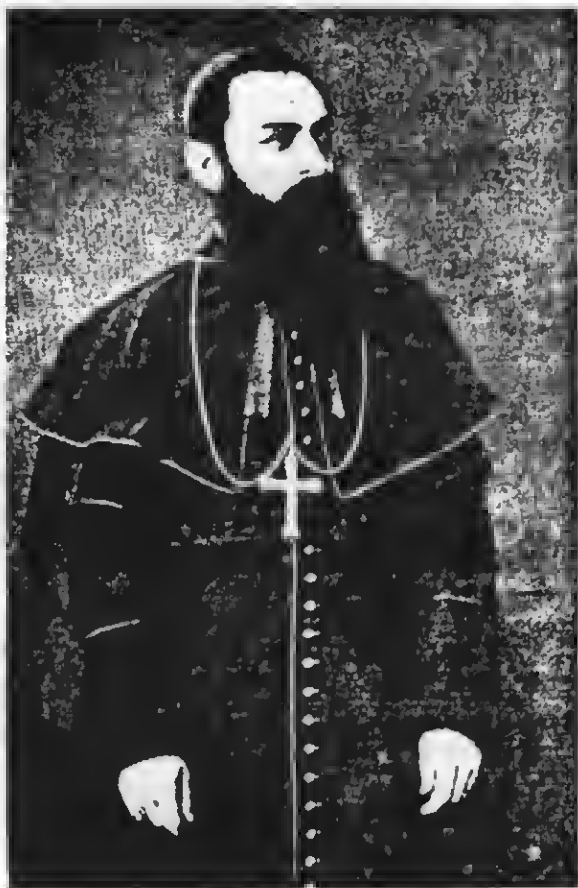
O Bispo D. Vital

A situação interna da República é difícil. EL SUPREMO, angustiado, vê conspirações por todos os lados. Em cada pessoa suspeita um traidor. Até nos mais íntimos. Na própria família. A própria mãe! Desconfia de tudo. Nos delírios da crueldade e da embriaguês a que se entrega frequentemente, manda torturar e fuzilar a melhor gente de Assunção. Em 1867, fôra preso no Rio de Janeiro o major prussiano Von Versen, contratado para servir nas hostes do tirano. influências ocultas conseguiram sua liberdade. O major alcançou Corrientes e de lá conseguiu corresponder-se com López. Finalmente, através do bloqueio chegou ao acampamento de Passo Pocú. López pensou que talvez fosse um assassino enviado pelos Aliados ou um espião de Mitre, apesar dos papéis em regra. Quem sabe não haviam substituído o indivíduo? Mandou vigiá-lo de perto e, depois, prendeu-o